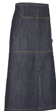
840 Dark Blue