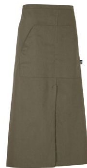
665 Dark Olive

Material: 100% ökologisch angebaute Baumwolle Fairtrade Gewicht: Twill 210 g/m 2 (665, 990), Denim 10,5 oz (840)