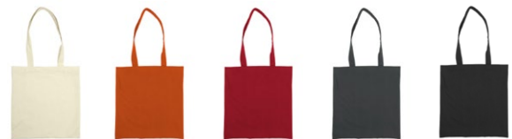
106 Natural 290 Orange 460 Red 990 Charcoal 990 Black

Gilt für alle Artikel auf dieser Seite: Maschinenwäsche: