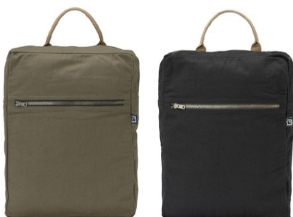
665 Dark Olive

Wir müssen immer Dinge mit uns nehmen. Zur Arbeit, von der Schule, die Zahnbürste, der Computer, Lebensmittel. Notwendigkeiten oder einfach Dinge, die man haben sollte. Cottover bietet eine kleine Kollektion der wichtigsten Träger, schlicht und erschwinglich, perfekt für grosse Drucke. Und wenn sie nicht gebrandet sind, sendet das Fairtrade-Label eine klare Botschaft.